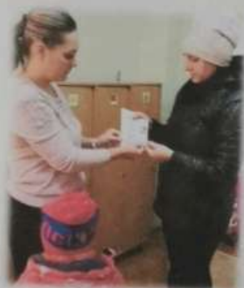
Мобильная библиотека в ДОУ для детей и родителей